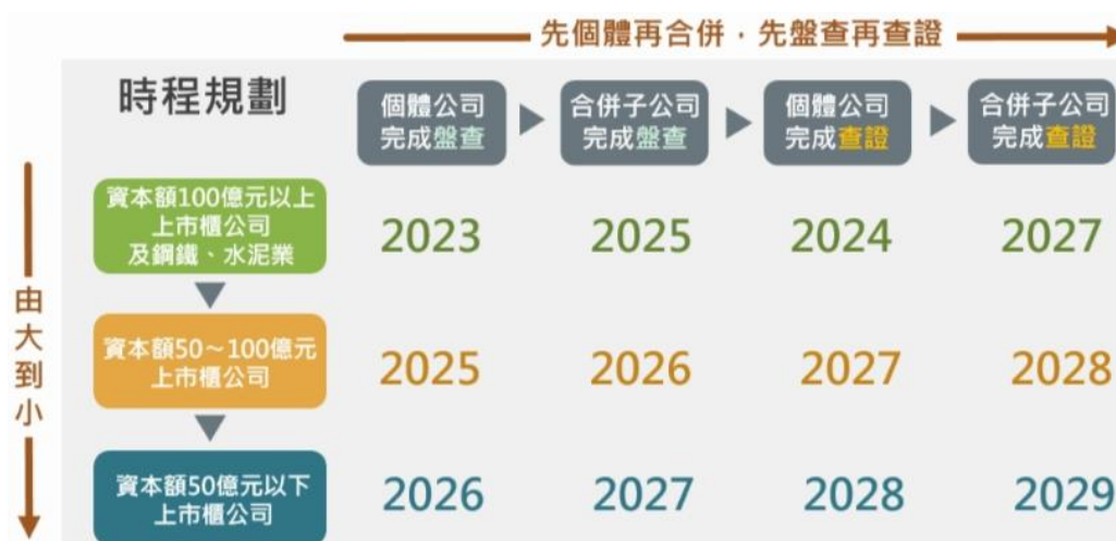
(圖 1：上市櫃公司永續發展路徑圖時程規劃)